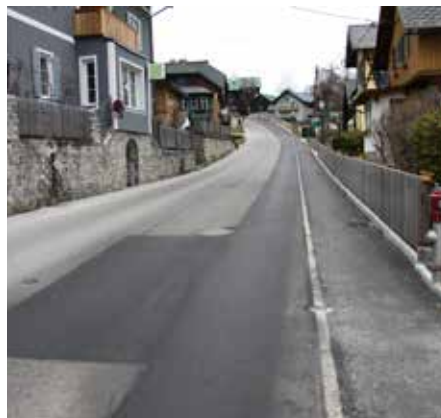
⋮ Gehweg auf der Marktleite zum Schutz der Fußgänger