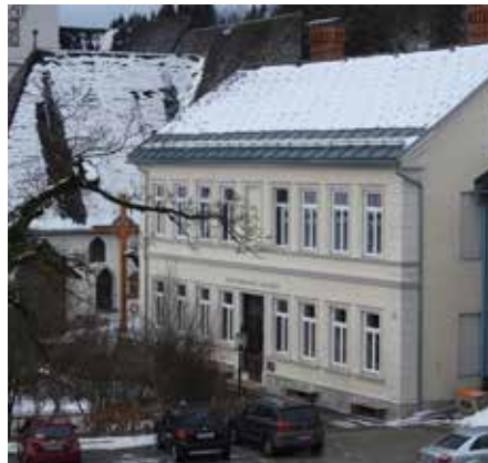
⋮ Der neue Stadtkindergarten