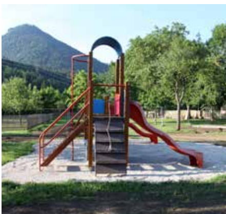
⋮ Neuer Spielplatz des Stadtkindergartens bei der Pfarre