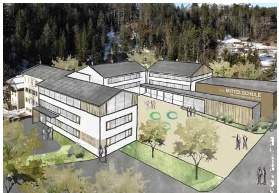
Die Neue Mittelschule wird nach der Sanierung eine moderne Bildungseinrichtung für zeitgemäßen Unterricht. (Abbildung: Planskizze)

Aufgrund der derzeit geltenden Corona-Ausgangsbestimmungen können Veranstaltungen dieser Größenordnung nicht in einem öffentlichen Rahmen stattfinden. Interessierte haben jedoch die Möglichkeit, die Präsentation anhand der Berichterstattung in den Medien zu verfolgen.