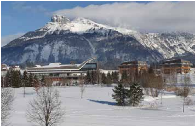
⋮ Narzissen Vital Resort