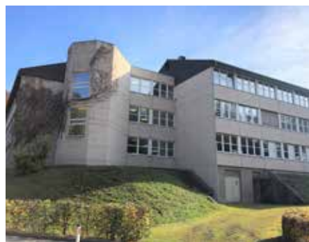
Oben: Grundriss. Unten: Das Gebäude der Neuen Mittelschule stammt aus den 60er- und 70er-Jahren.