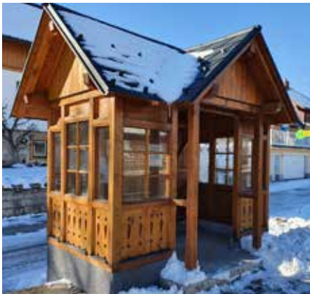
⋮ Das neue Bus-Wartehaus Brandhof