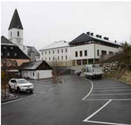
⋮ Der öffentliche Parkplatz Kirchengasse