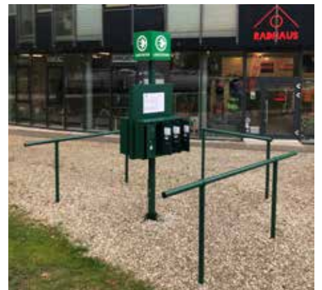
⋮ Eine E-Bike-Ladestation wurde beim Radhaus installiert.