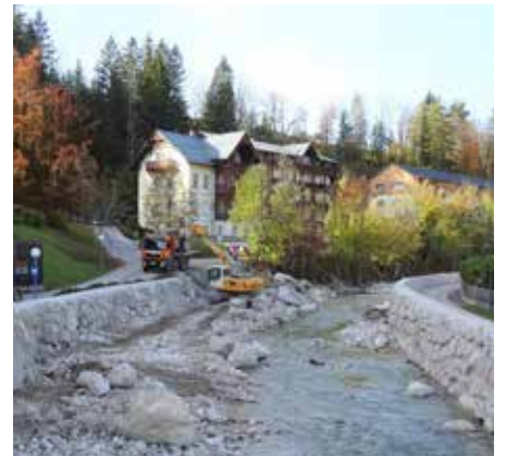
⋮ Hochwasserschutz Altausseer Traun