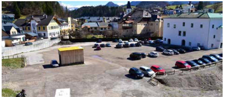
Parkplatzstreit auf dem Areal des ehemaligen Vitalbads bald beigelegt

Die Nachforschungen betreffend der MB BA Hotel Errichtungs GmbH zeigten außerdem, dass am Firmensitz in Bad Gleichenberg kein Firmenschild vorhanden ist. Das erklärt, warum die Zustellversuche behördlicher Schriftstücke erfolglos blieben. Über die prekäre finanzielle Situation der MB BA Hotel Errichtungs GmbH liegt der Gemeinde eine Auskunft des Kreditschutzverbands vor.