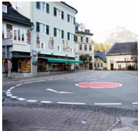
⋮ Der neue Kreisverkehr im Ortskern sorgt für Sicherheit.