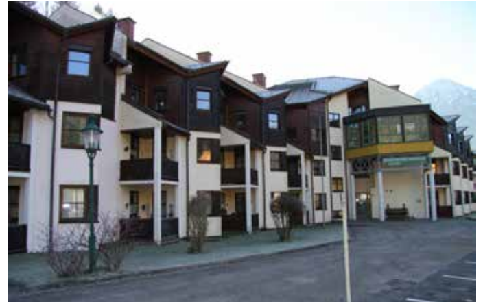
⋮ Hochwertiger Wohnraum in den neuen Gemeindewohnungen in der Grundlseeer Straße