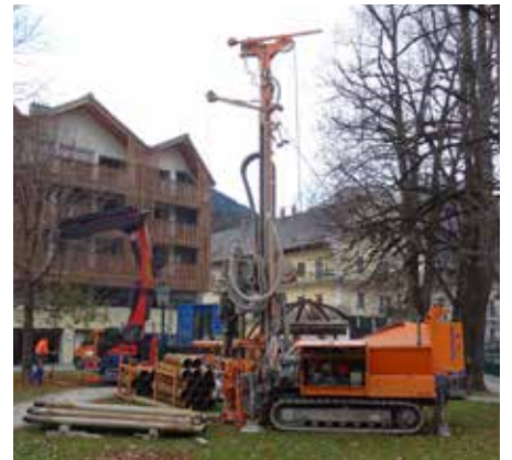
⋮ Neue Frischwasserquelle – Tiefbrunnen – im Kurpark