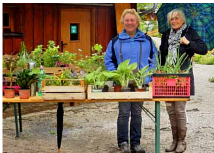
Beim Gartentag am 23. Mai 2015 werden wieder Pflanzen, Stecklinge und alles rund um den Garten getauscht und verkauft.

Die frühe Pracht erfreut leider zumeist die Gärtner allein, denn viele Freunde des Alpengartens wissen leider nicht, dass dieses Blütenidyll auch geöffnet hat, wenn das Alpengartenteam noch tief in den Vorbereitungsarbeiten steckt und