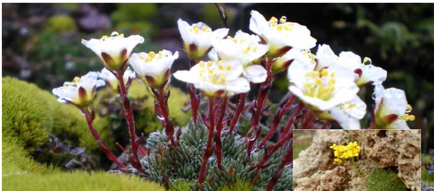
Die weiße Saxifraga ist eine von vielen Pflanzen, die im Alpengarten bereits früh im Jahr zu bewundern sind.