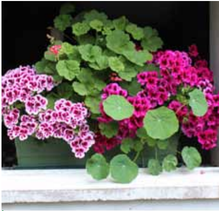
Schöne Blumen sind eine Bereicherung für jedes Haus und für das gesamte Ortsbild unserer schönen Stadt.