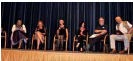
Aussee Gespräche 2015 25. bis 28. Juni