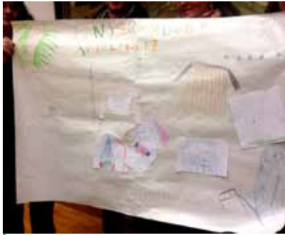
Die Kinder der Nachmittagsbetreuung präsentierten ihren Plan des Generationenparks.

Beim kürzlich stattgefundenen Treffen der Arbeitsgruppe familienfreundliche Gemeinde widmete sich die Gruppe der Planung des Generationenparks. Die dabei gesammelten Ideen werden nun zu einem Gesamtkonzept zusammengefasst.