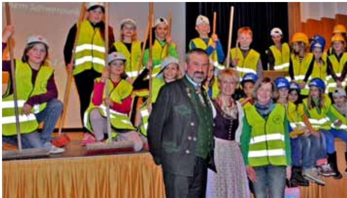
Die Kinder der Volksschule Bad Aussee bereicherten den interessanten Abend rund um die Präsentation des Projekts Volksschule neu.

Am 12. März 2015 wurde die jahrelang geforderte Volksschulsanierung mit Neubau im Kur- und Congresshaus Bad Aussee anlässlich einer Gemeindeversammlung präsentiert.