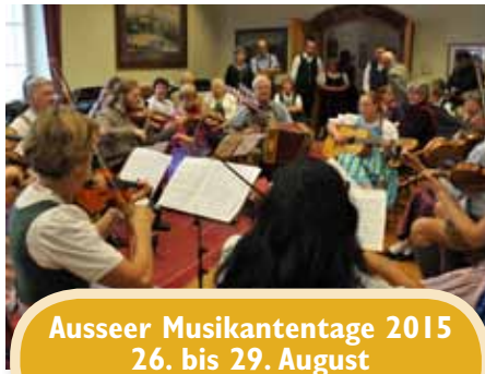
Aussee Musikantentage 2015 26. bis 29. August