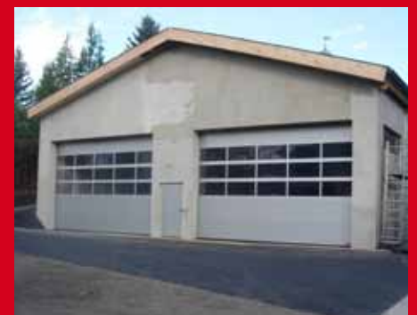
Das um- und ausgebaute Feuerwehrdepot in Reitern wird am 16. Mai offiziell eröffnet.

umsetzen und das Gebäude zur provisorischen Nutzung freigeben. Im Winter erfolgten dann die Arbeiten am Innenausbau. Die offizielle Eröffnung findet am 16. Mai 2015 statt. BHI Franz Loitzl und seine Kameradinnen und Kameraden laden alle Interessierten dazu herzlich ein!