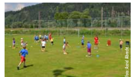
Spiel, Sport und Spaß stehen bei den Memory-Camps für Kinder im Mittelpunkt.

Aktuelle Folder zur Anmeldung werden in den Schulen und Kindergär-