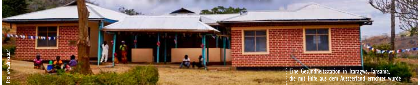
Eine Gesundheitsstation in Itaragwe, Tansania, die mit Hilfe aus dem Ausseerland errichtet wurde