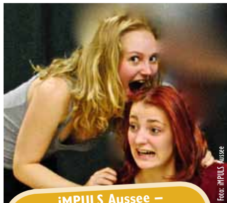
iMPULS Aussee – BÜHNE Authentic Samstag, 25. April, 20 Uhr Kur- & Congresshaus Bad Aussee

Die Ausseerinnen und Ausseer haben eine stolze Tradition in der Überlieferung echter Volksmusik. Diese Tradition wird bei den bekannten Ausseer Musikantentagen gepflegt. Ein Team aus engagierten Volksmusikanten wird bei den Ausseer Musikantentagen auch 2015 wieder die Faszination der echten Volksmusik vermitteln. Die Ausseer Musikantentage 2015 finden von 26. bis 29. August statt. Weitere Informationen erhalten Sie in der nächsten Ausgabe des „Aussee“.