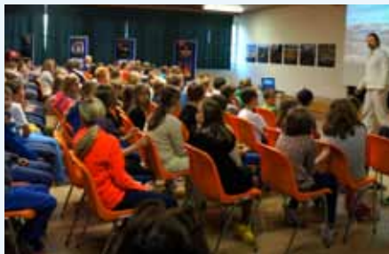
Anhand spannender Vorträge wird der verantwortungsbewusste Umgang mit Energie vermittelt.

Dieses Projekt wird vom Klima- und Energiefonds unterstützt und umfasst die gesamte Region. Geplant ist ein ganzjähriger Betrieb, wobei lediglich Spitzentage wie der Narzissenfestsonntag oder der Altausseer Kirtag ausgenommen sind. Mit einem sehr günstigen Einheitspreis von 4,50 Euro pro Person werden Strecken bis zu 10 km abgedeckt und damit ein Anreiz geschaffen, möglichst auf sein Auto zu verzichten.