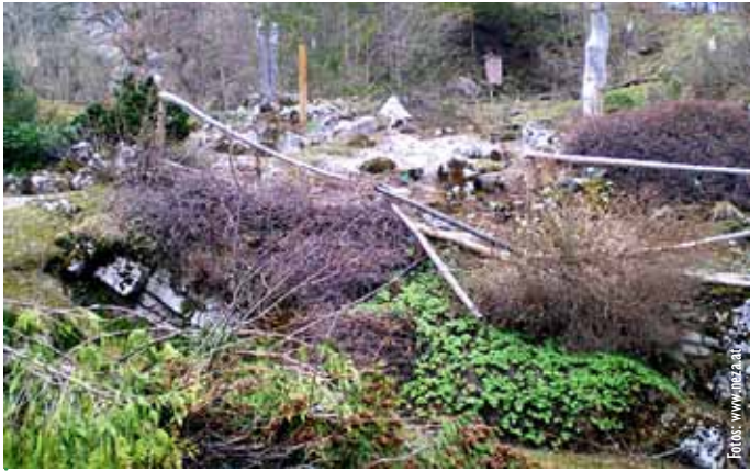
Die strengen Winter im Ausseerland richten auch im Alpengarten oft schwere Schäden an, die das Alpengartenteam beseitigen muss.

der Eintritt noch kostenlos ist. So kommt es, dass paradoxerweise gerade die typischen wunderschönen Alpenpflanzen im Alpengarten selten bewundert werden.