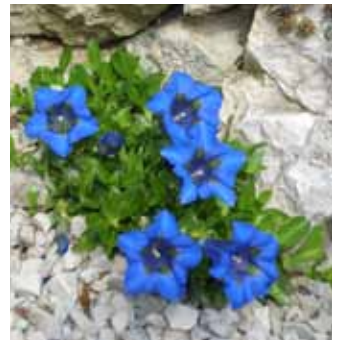
Einzigartig – der stengellose Enzian