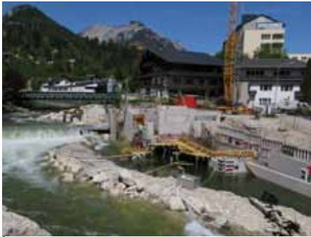
Die Baustelle im Bereich Reiterer Brücke/ Parkplatz Ischler Straße