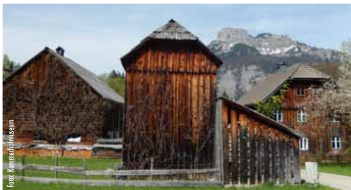
Photo: Kammerhofmuseum Bauernhaus, Stall und Troackasten eines Altausseer Haufenhofes

Ab 25. Juli: Nach einer kurzen Darstellung der frühen Siedlungsgeschichte des Ausseerlandes widmet sich die Sonderausstellung vor allem der Ausseer Baukultur in ihrem historischen Kontext, wobei es in erster Linie um Bauwerke „in der Landschaft“ geht. Es wird auch das gesellschaftlich heikle Thema der Zerstörung des Landschaftsbildes durch problematische Raumplanung angesprochen und versucht, Zukunftsperspektiven aufzuzeigen.