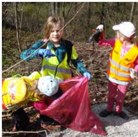
Fleißige Kinder mit ihren Fundstücken