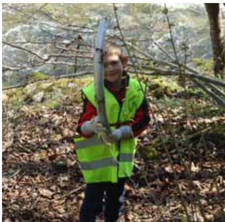
Teilweise wurden kuriose Dinge gefunden.