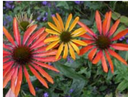
Die herrlichen Blüten der Echinacea Sorte

bewundert werden können. Für Schulklassen gibt es spezielle Workshops im Alpengarten und im Labor der Anlage. Das NEZA-Haus mitten im Alpengarten kann auch für Veranstaltungen sowie Feiern und Seminare genutzt werden. Infos unter www.neza.at