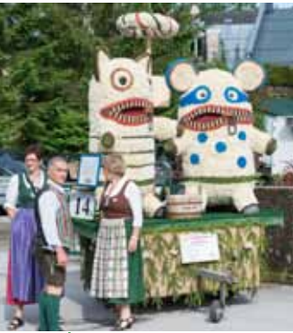
Die Sorgenfresser des Tanzsport- clubs Happy Dance Ausseerland wurden Vierter.