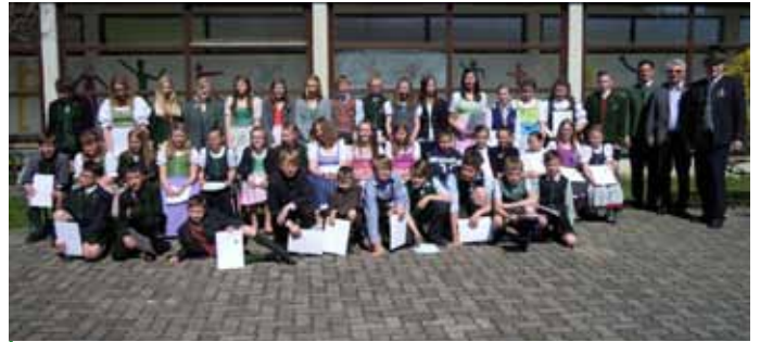
Die 54 erfolgreichen Jungmusikerinnen und Jungmusiker aus dem Ausseerland mit ihren Musikpädagogen