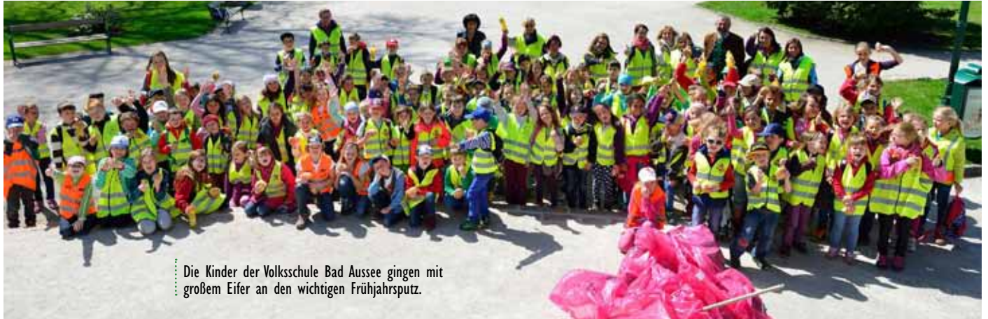
Die Kinder der Volksschule Bad Aussee gingen mit großem Eifer an den wichtigen Frühjahrsputz.

Beim diesjährigen großen steirischen Frühjahrsputz gab es im Ausseerland einen Teilnehmerrekord – ein großer Gewinn für die Umwelt und die gesamte Region.