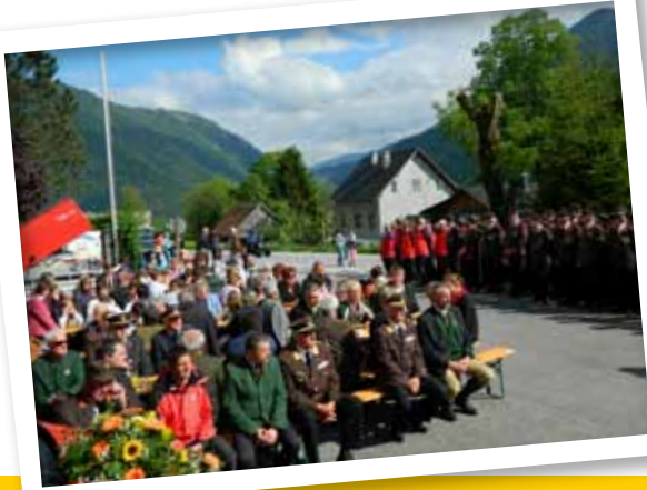
Der wichtige Zubau am Rüsthaus der Freiwilligen Feuerwehr Reitern wurde am 16. Mai feierlich eingeweiht.