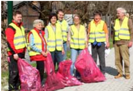
Auch die SPÖ Bad Aussee half bei der Sammlung mit.

Alle Steirerinnen und Steirer waren im April eingeladen, beim landesweiten großen steirischen Frühjahrsputz mitzumachen und die Wiesen, Wälder, Grünanlagen, Wege und Bachläufe von unachtsam weggeworfenem Müll zu säubern. Besonders erfreulich war der neue Höchststand an Teilnehmern im Ausseerland. Rekordverdächtig war leider auch die gesammelte