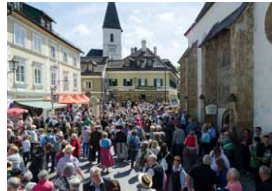
Der Stadtkorso feierte auch in seiner zweiten Auflage einen großen Erfolg. Tausende Besucher bummelten ohne Zeitdruck gemütlich zwischen Figuren, Geschäften und Lokalen im Stadtzentrum hin- und her.