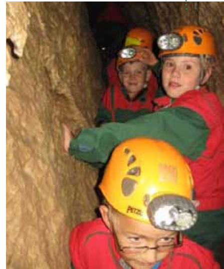
Die Erforschung der Koppenbrüllerhöhle ist immer wieder ein Riesenspaß.

erfolgt nach Anmeldedatum. Das gesamte Programm ist auf der Homepage unter www.badaussee.at nachzulesen. Das Ferienspaßheft kann im Bürgerservice abgeholt werden. Informationen gibt es bei Horst Binna, Tel.: 52511-26