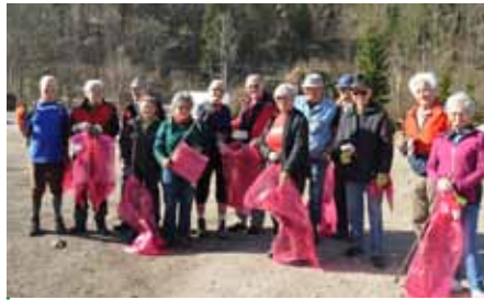
Mitglieder des Alpenvereins stellten sich ebenfalls in den Dienst der guten Sache.