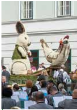
Die Osterhasenwerkstatt von Gaisberger, Marl und Freunden siegte in der Kategorie Alte Aufbauten.