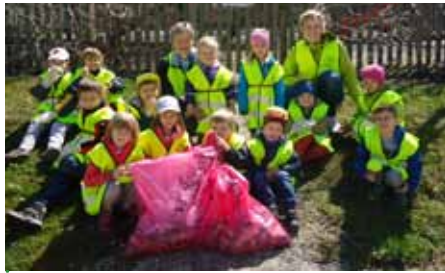
Auch die Kinder des Gemeindekindergartens Villa Minna beteiligten sich mit Freude.