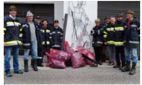
Die FF Obertressen mit ihren „gesammelten Werken“

Alle Steirerinnen und Steirer waren im April eingeladen, beim landesweiten großen steirischen Frühjahrsputz mitzumachen und die Wiesen, Wälder, Grünanlagen, Wege und Bachläufe von unachtsam weggeworfenem Müll zu säubern. Besonders erfreulich war der neue Höchststand an Teilnehmern im Ausseerland. Rekordverdächtig war leider auch die gesammelte