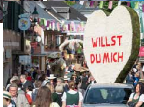
Das Stadtzentrum von Bad Aussee wurde für eine ganze Woche zu einer großen, gut frequentierten Bühne.