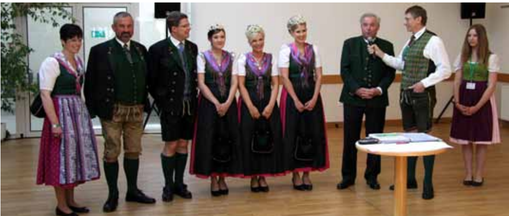
Landeshauptmann Hermann Schützenhöfer ließ sich seinen schon fast traditionellen Besuch beim Narzissenfest auch am Wahlsonntag nicht nehmen.